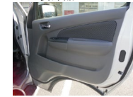
FR 800R室内側 コンソール部品