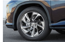
オーバーフェンダー