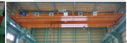
走行親子クレーン 15T-7.5T