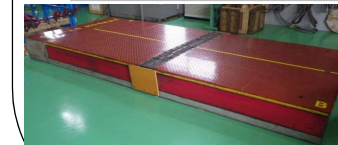
デンソン 金型反転機