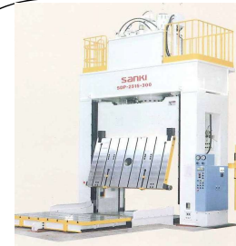
ダイスポッティングプレス 2515-300t