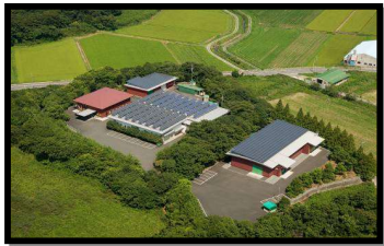
自然との共存を目指す超精密加工工場

各設備は担当者が毎日点検を行っています。 設備講習毎に標準書を作成し、作業の統一を試みています。