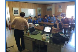
職長教育・安全会議(月)

◇工機工場 〒824-0022 福岡県行橋市大字稲童433-8 TEL&FAX 0930-25-8506