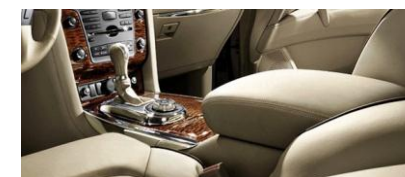
Nissan PATROL コンソールボックス