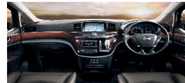
Nissan ELGRAND インストルメントパネル