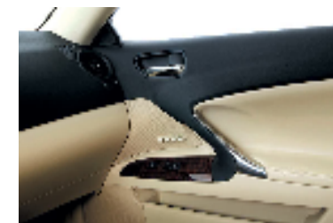
Lexus IS 250 C ドアトリムアッパー