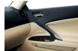
Lexus IS 250 C ドアトリムアッパー