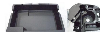
Lexus CT200h デッキボックス、他