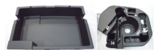
Lexus CT200h デッキボックス、他