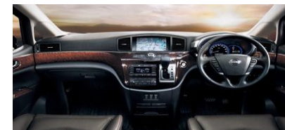
Nissan ELGRAND インストルメントパネル