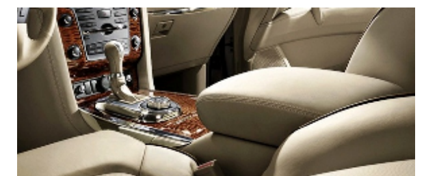
Nissan PATROL コンソールボックス