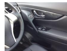
Nissan X-Trail ドアアームレスト