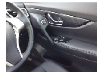
Nissan X-Trail ドアアームレスト