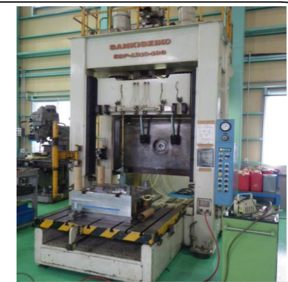
ダイスポットティングプレス 1310-100t