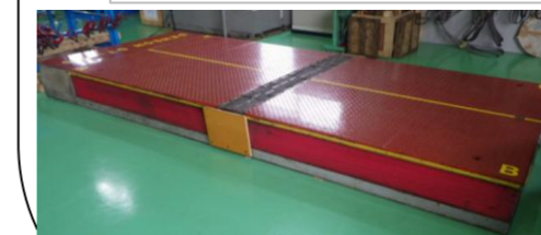
デンソン 金型反転機