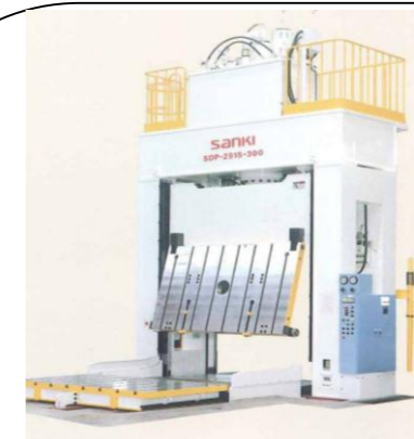
ダイスポットティングプレス 2515-300t