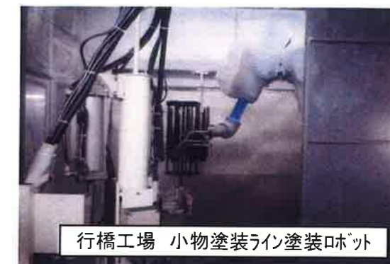
行橋工場 小物塗装ライン塗装ロボット