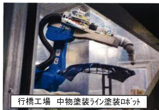
行橋工場 中物塗装ライン塗装ロボット