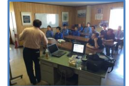
職長教育・安全会議(月)

◇工機工場 〒824-0022 福岡県行橋市大字稲童433-8 TEL&FAX 0930-25-8506